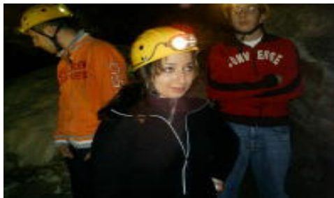
Alunni dentro la grotta Conza

Giovedì 30 Marzo 2006 è stata organizzata dalla scuola una escursione nella riserva naturale di Grotta Conza che si trova in prossimità della borgata storica di Tommaso Natale. Le grotte rappresentano una particolarità della natura, legata ai processi di formazione ed evoluzione. Hanno un proprio clima interno, nella quale possono vivere particolari forme animali e vegetali; possiedono una propria storia geologica e per questo mostrano una propria bellezza, creata dal lavoro dell'acqua che nel corso dei secoli ha formato stalattiti e stalagmiti di varia forma e colore. È stata una esperienza molto divertente e, soprattutto, interessante anche se siamo rimasti un po' delusi dal fatto che molti alunni non hanno voluto partecipare. E' un vero peccato che vengano sciupate in questo modo le occasioni che la scuola ci offre per arricchire il nostro percorso formativo!