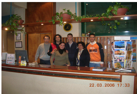
Gli alunni e i tutors alla reception dell'albergo.